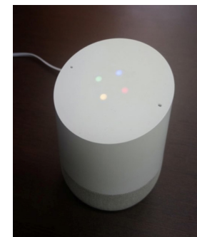
圖 2. 結合物聯網技術的語音助理 Google Assistant

「遠端臨場機器人(telepresence robot)」技術複雜度較低，相關產品如Double、RP-Vita、VGo等已經廣泛應用於醫療照護。這類型遠端臨場機器人通常包含視訊系統及可移動載具，照護者可於遠端登入後指示機器人移動或執行其他動作，並透過視訊會議系統和近端被照護者溝通。目前這些遠端臨場機器人相關產品雖然能達到人與人溝通、陪伴功能，然而整體人機介面設計比較類似「移動式視訊會議系統」，缺乏可親近感及擬人化的趣味，較難為居家使用者接受；此外這些遠端臨場機器人