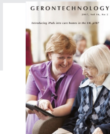
圖 4. 英國的「iPad 計畫」，將 iPad 實際引入養護機構

2017年該計畫評估報告顯示，三年之後幾乎所有的養護機構都仍在照護流程中實際使用計畫提供的iPad，有接近60%的養護機構幾乎每天都在使用，住民中以失智者、學習障礙者及行動不便者對iPad接受度及興趣最高。98%的照護中心工作人員均表示，引入iPad這樣的智慧科技產品，有效地提升了傳統活動的品質，豐富了住民的生活；此外照護人員也表示，以往傳統活動的設計往往很花費時間，且實際帶活動時的不確定性造成住民參與意願降低，達不到預期效果，並嚴重增加照護人員的壓力，相對的引用iPad之後，智慧照護的靈活性及趣味性有效減低了照護人員的壓力。此外，iPad的引入還增加了住民與家人之間的互動，多數家屬表示這樣的互動幫助他們更瞭解親人的生活，也豐富了住民的生活甚至可以提供失智者一定程度的懷舊治療，同時照護人員也可以藉由這樣的活動從家屬那裡得知更多高齡者的故事及生活習性，並實際運用於照護中(Evans et al., 2017)。