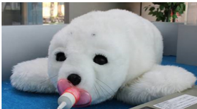
圖 1. 陪伴型機器人 Paro

能對特定的語音或動作做出預先設定的反應，但仍不如真人或寵物能有獨特的個性，且往往價格和技術複雜度過高（Paro售價高達美金6,000元），反而很難落實成為居家使用的產品。另一方面「遠端臨場」技術也常應用於陪伴型機器人開發，是受到遠端使用者控制的機器人。遠端臨場(telepresence)由字面上解釋，是"tele"（電傳、遠傳）加上"presence"（臨場、存在）的意義組合。「遠端臨場」技術結合虛擬實境、人機介面、通訊技術與機械人，麻省理工學院Sheridan教授定義遠端臨場技術為，將遠端真實的環境資訊傳回給近端的使用者，讓近端使用者有身處遠端環境的臨場感，而使用者也藉由遠端臨場技術接觸到遠端真實的人、事、物，產生互動關係(Sheridan, 1992)。